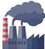
โรงงานอุตสาหกรรม