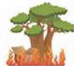
การเผาเศษวัชพืชและขยะ