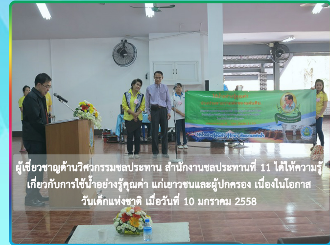
ผู้เชี่ยวชาญด้านวิศวกรรมชลประทาน สำนักงานชลประทานที่ 11 ได้ให้ความรู้ เกี่ยวกับการใช้น้ำอย่างรู้คุณค่า แก่เยาวชนและผู้ปกครอง เนื่องในโอกาส วันเด็กแห่งชาติ เมื่อวันที่ 10 มกราคม 2558

พระราชดำรัสพระบาทสมเด็จพระเจ้าอยู่หัว เมื่อวันที่ ๑๗ มีนาคม ๒๕๒๗