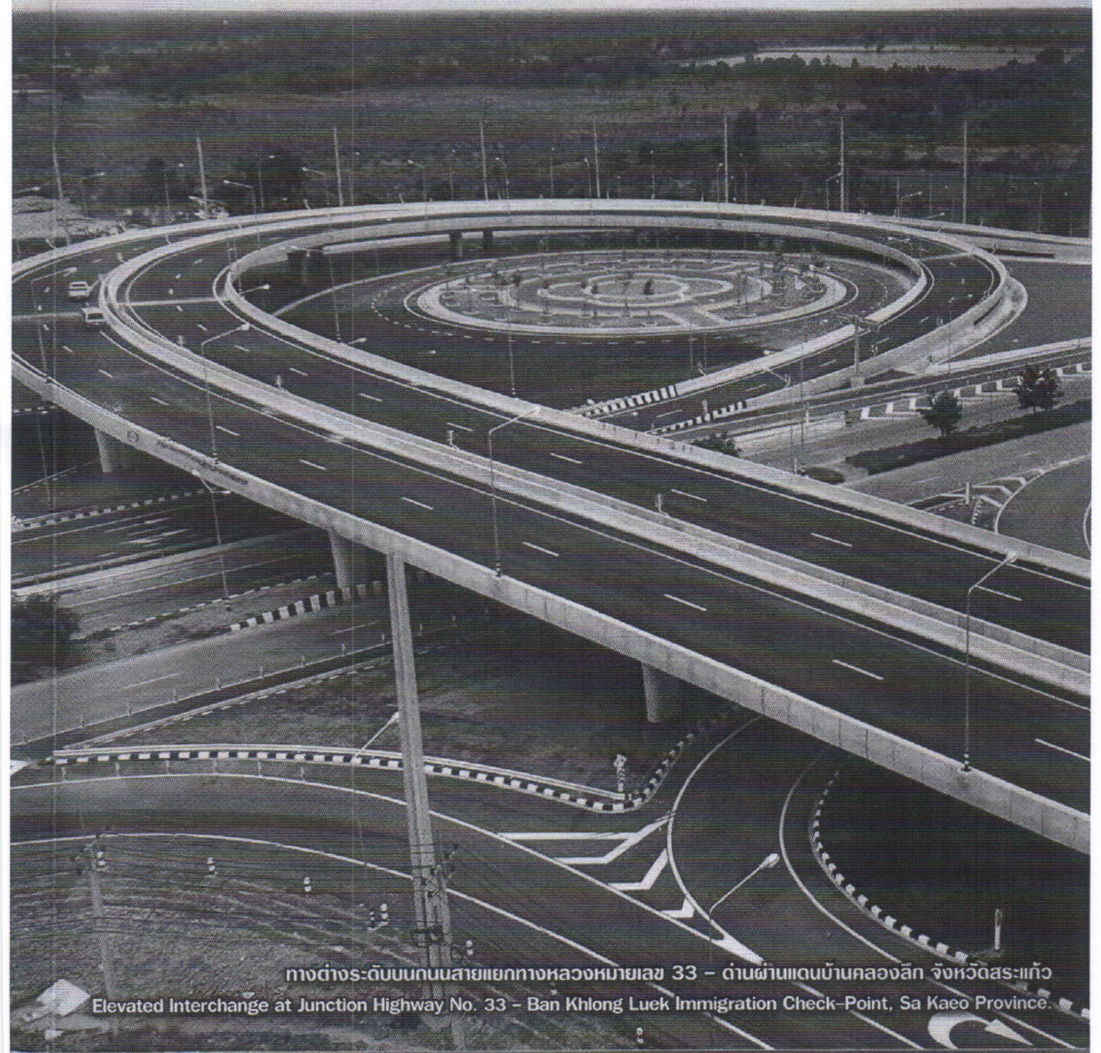
ทางต่างระดับบนถนนสายแยกทางหลวงหมายเลข 33 - ด้านผ่านแดนบ้านคลองลึก จังหวัดสระแก้ว Elevated Interchange at Junction Highway No. 33 - Ban Khlong Luck Immigration Check-Point, Sa Kaeo Province.