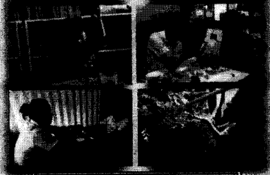
การฝึกทักษะต่าง ๆ