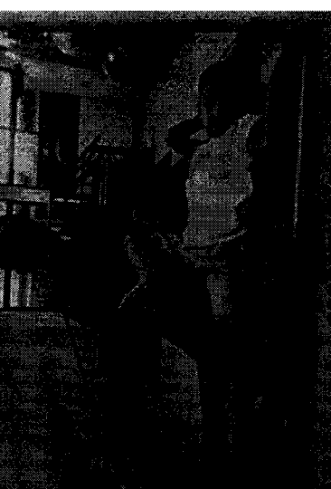
การเตรียมตัวก่อนเข้าทำงาน (การฝึกงานเบื้องต้น)