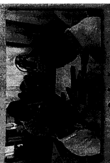
การเตรียมตัวก่อนเข้าทำงาน (การฝึกงานเบื้องต้น)