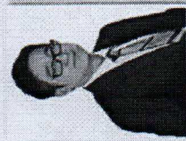
รองคณบดีฝ่ายวิชาการ