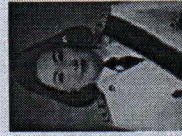
น.ส.ปณทิก สมิตี ปลัดกระทรวงแรงงาน