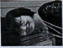
รองคณบดีฝ่ายบริหาร