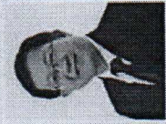
นายแพทย์โสภณ เมฆธน ปลัดกระทรวงสาธารณสุข