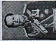
พลเอกอุพงษ์ ฝาชินดา รัฐมนตรีว่าการกระทรวงมหาดไทย