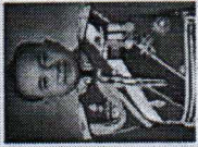
พลเอกธีระวัฒน์ บุญประเสริฐ อธิบดีกรมผู้บัญชาการทหารบก สมาชิกสภาผู้บัญญัติแห่งชาติ