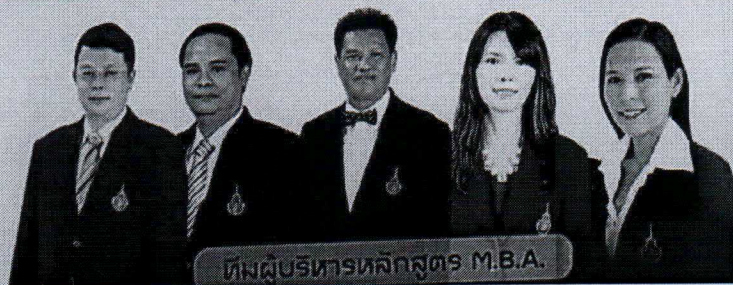
ทีมผู้บริหารหลักสูตร M.B.A.

สอบถามเพิ่มเติมได้ที่ 02-665-3555 ต่อ 2391