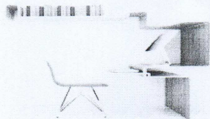
ภาพที่ 1 ชื่อภาพตัวอย่าง ที่มา: สมบูรณ์ และคณะ (2554)

ระยะห่างจากบรรทัดหลังย่อหน้าทีเลือกเท่ากับ 6 พอยท์ (Spacing After 6 pt)